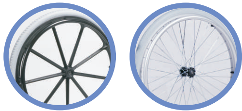
Rodzaj kół do wyboru: obręcze plastikowe lub szprychowe

W standardowej wersji wyposażony jest w podnóżki z regulacją kąta nachylenia do poziomu z podparciami podudzia. Wózek posiada konstrukcję modułową, standardową wersję można rozbudowywać i modyfikować w taki sposób aby spełniała jak najlepiej oczekiwania osoby poruszającej się na wózku, które w trakcie używania mogą ulegać zmianom. Użytkownik nie musi zaopatrywać się w nowy wózek, którego koszt jest znacznie wyższy aniżeli dokupienie jedynie podzespołów, które po zamontowaniu do wózka zapewnią dalszą eksploatację, komfort i użyteczność.