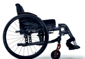
C86 Szary karbon

Dostępna jest możliwość wyboru spośród wielu odcieni, co pozwoli Ci spersonalizować swój wózek inwalidzki i naprawdę podkreślić swoją wyjątkowość.